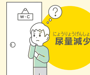
尿量減少 にょうりょうげんしょう