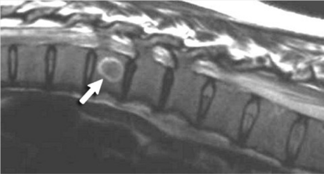
ノバルティス ファーマ社内資料