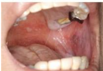
Gr.2 口蓋と左頬粘膜に潰瘍