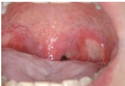
Gr.2 左軟口蓋部の潰瘍