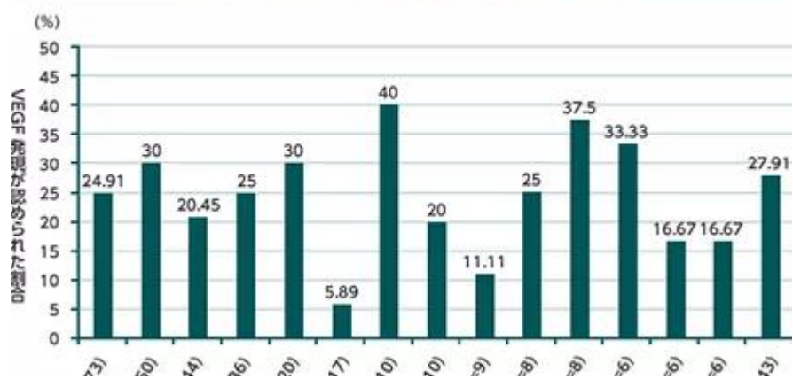
組織型別 VEGF 発現の頻度 (海外データ)