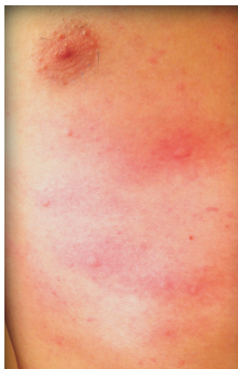
▲ 2.5 Urticaria colinérgica.

Las urticarias inducibles se producen tras la aplicación de diferentes estímulos externos en el lugar de la piel donde aparecen. Se consideran urticarias inducibles todas las desencadenadas por estímulos físicos (frío, calor, presión, sol, vibración, roce o rascado), así como la urticaria colinérgica (inducida por la elevación activa o pasiva de la temperatura corporal) y la urticaria de contacto por alérgenos (látex, alimentos, animales, etc.) 1 .