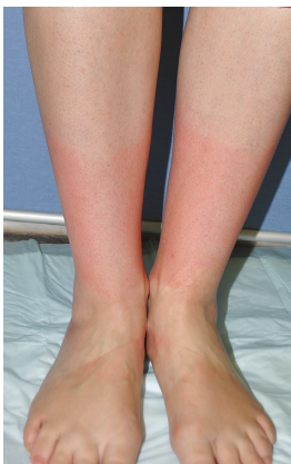
▲ 2.4. Urticaria solar.