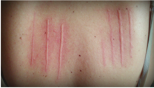
▲ 2.1. Dermografismo sintomático.